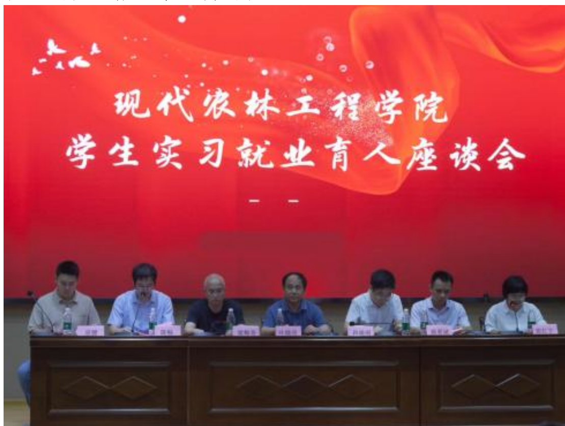
图 2-11 2024 年校园实习就业育人座谈会