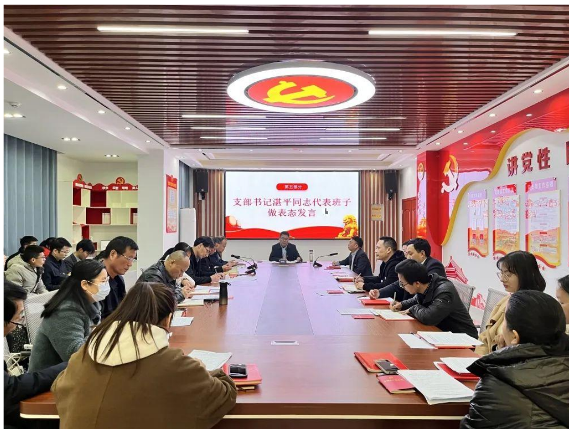
图 7-3 “学习党的二十大精神”主题活动

全体教师共同上专题微党课《坚守教育初心 勇担育人使命》，学习习近平总书记在党的二十大报告中关于教育的重要论述。