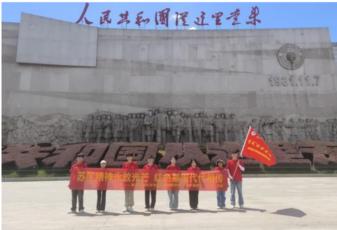
图 4-3 社会实践团成员们来到瑞金市红都广场