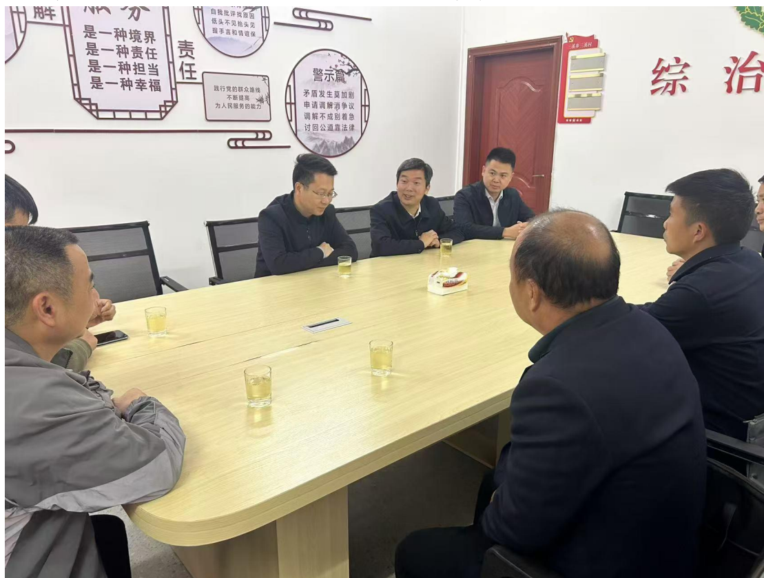
图 3-3 书记调研驻村帮扶工作

乡村振兴政策，切实开展帮扶工作，学校压实驻村工作队责任，做好产业、就业、教育帮扶，通过定期跟踪走访村民、村小组、脱贫户、三类对象等，解决村民迫切需求，规划长期经济发展项目，巩固拓展脱贫攻坚成果。