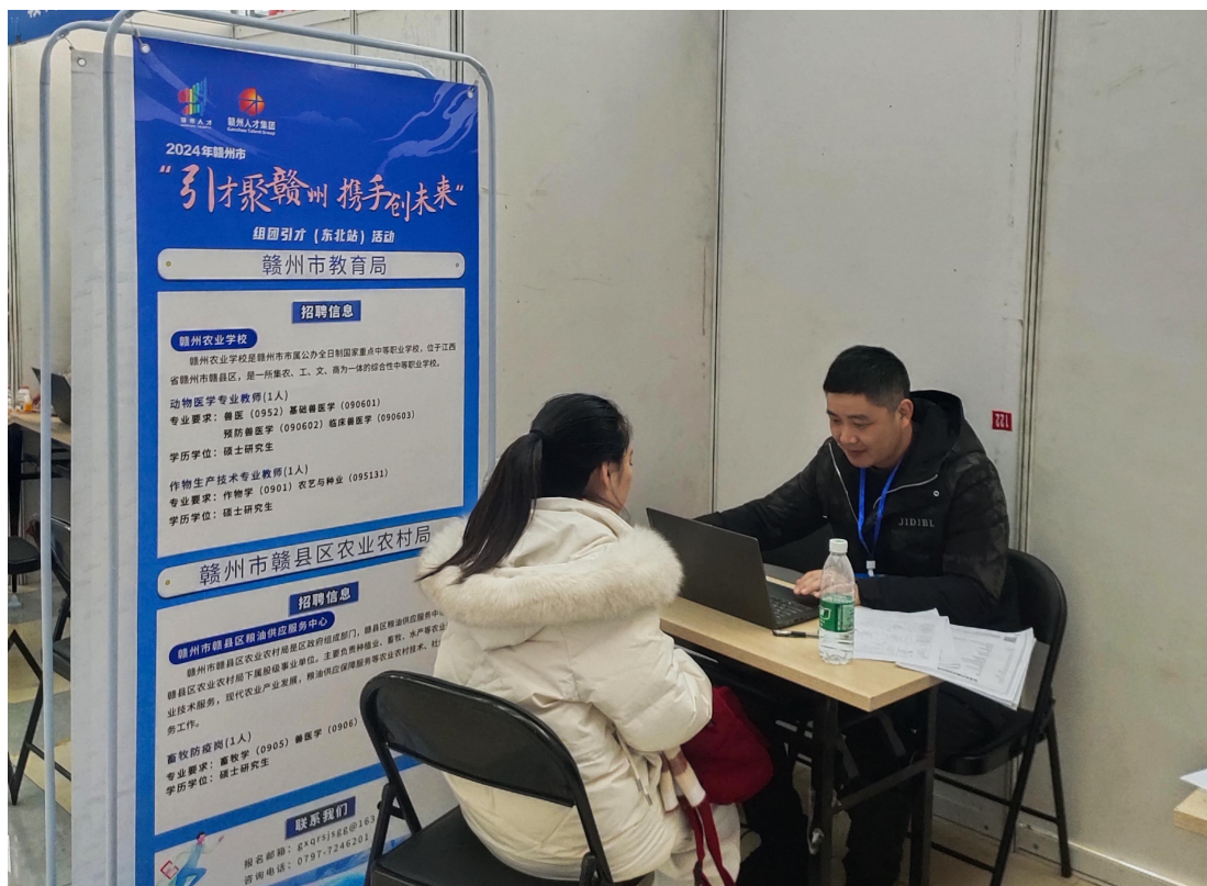
图 7-4 “引才聚赣州 携手创未来”招聘

根据赣州市人才引进工作的方针、政策和专业建设需求，针对学校实际，参加赣州市“引才聚赣州 携手创未来”事业单位招聘高层次人才（东北站），招聘高层次人才两名。