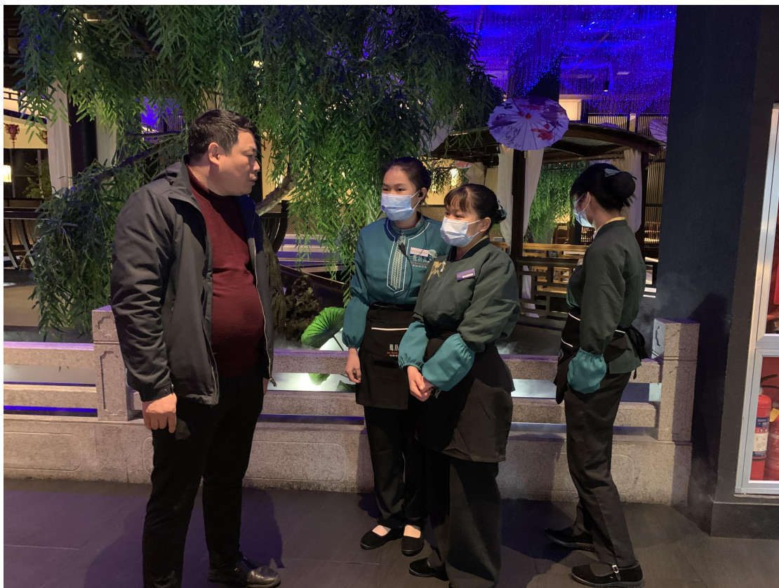
图 2-10 开展访企拓岗考察调研活动

调查显示，毕业生满意度为97.67%，毕业生工作与专业相关度为51.39%，职业期待吻合度为60.35%，有91.82%的毕业生表示对当前工作比较适应，毕业生所在单位的工作稳定性为78.19%，毕业生所在单位的人员流动相对稳定，有助于毕业生职业发展顺利度的提升。