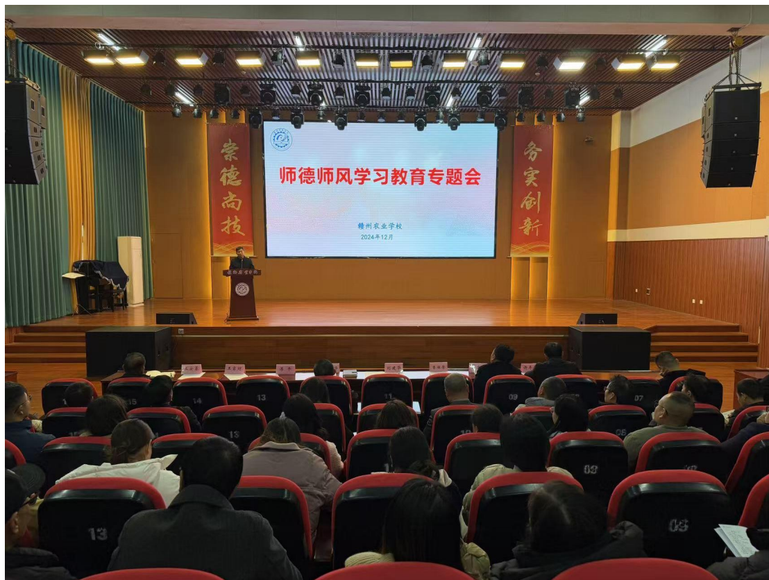
图 2-4 中共赣州农业学校党员大会