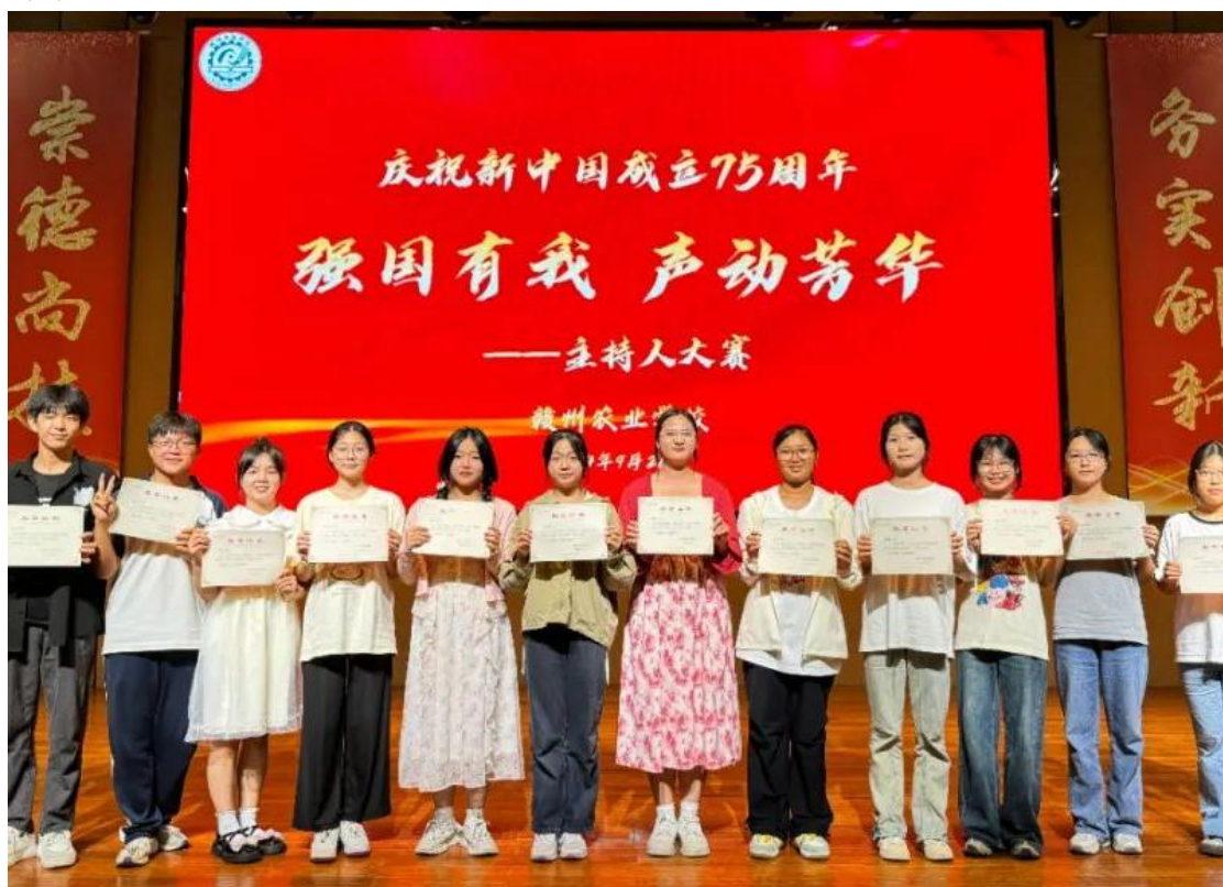
图 2-8 “强国有我，声动芳华”主持人大赛

赛不仅是一次才艺的盛宴，更是一次心灵的洗礼和精神的升华。比赛中，参赛者们怀揣着对祖国的深厚情感，用他们响亮而深情的声音，诉说着对祖国的热爱与美好祝愿。他们的表现不仅彰显了新时代青年的责任与担当，更展现了青春的力量与风采。无论是慷慨激昂的朗诵，还是细腻温柔的诉说，都深深打动在场的每一位观众，赢得了阵阵掌声和喝彩。