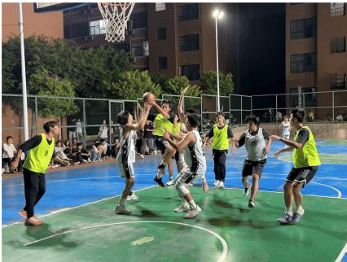
图 2-9 校园篮球联赛

员们的脸上写满了专注和坚毅。他们不畏强敌、不惧困难，用汗水和努力书写着属于自己的篮球传奇。这不仅是一场体育竞技的盛宴，更是一次青春与梦想的华丽绽放！