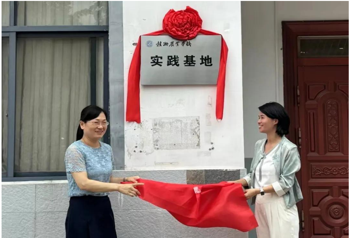
图 6-8 “蜜月岛” 实践基地揭牌