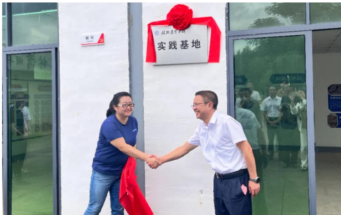
图 6-7 三溪乡湖羊实践基地揭牌

该基地位于作赣县区三溪乡下浓村，现有羊舍 15 栋，存栏湖羊 7000 余头，年出栏羊羔可达 1.2 万头，是江西省最大的湖羊养殖基地，2021 年 8 月全国首个湖羊产业“科技小院”落户该基地。