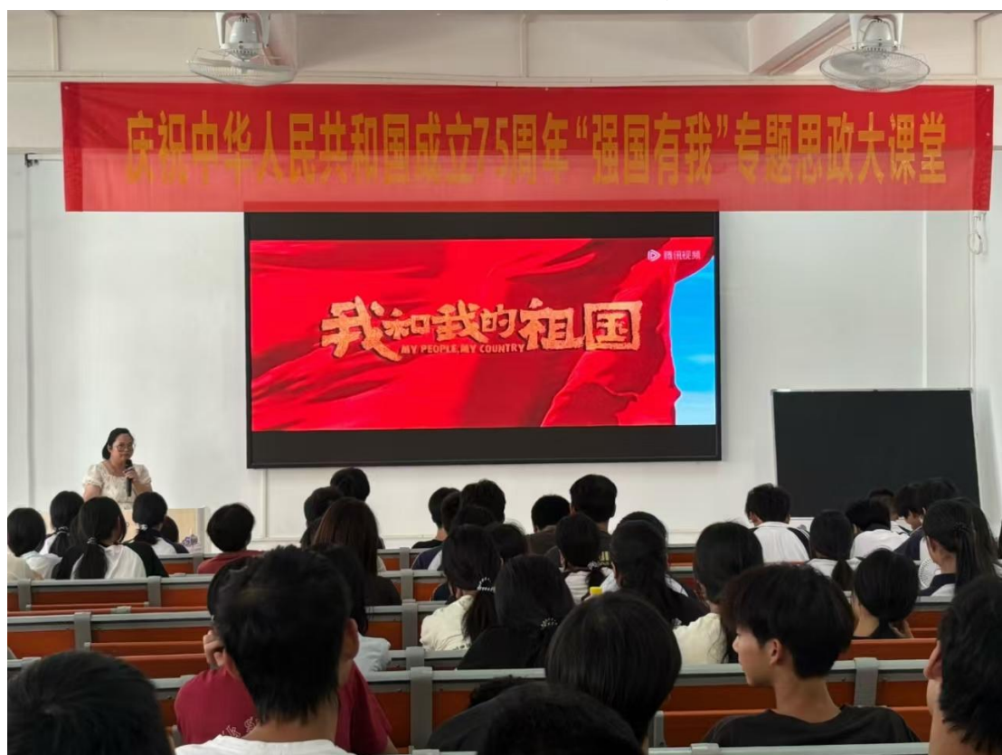
图 2-7 “强国有我”专题思政大课堂