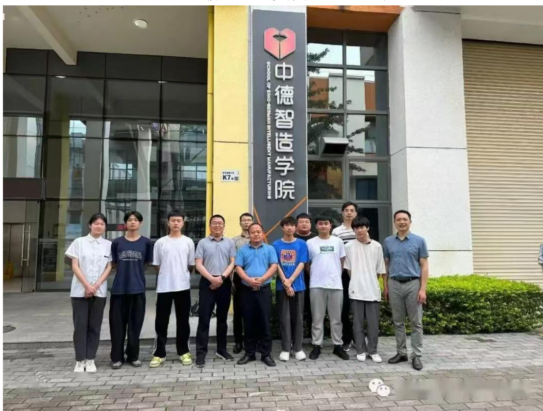
图 6-4 师生前往深圳中德智造学院参加研学活动