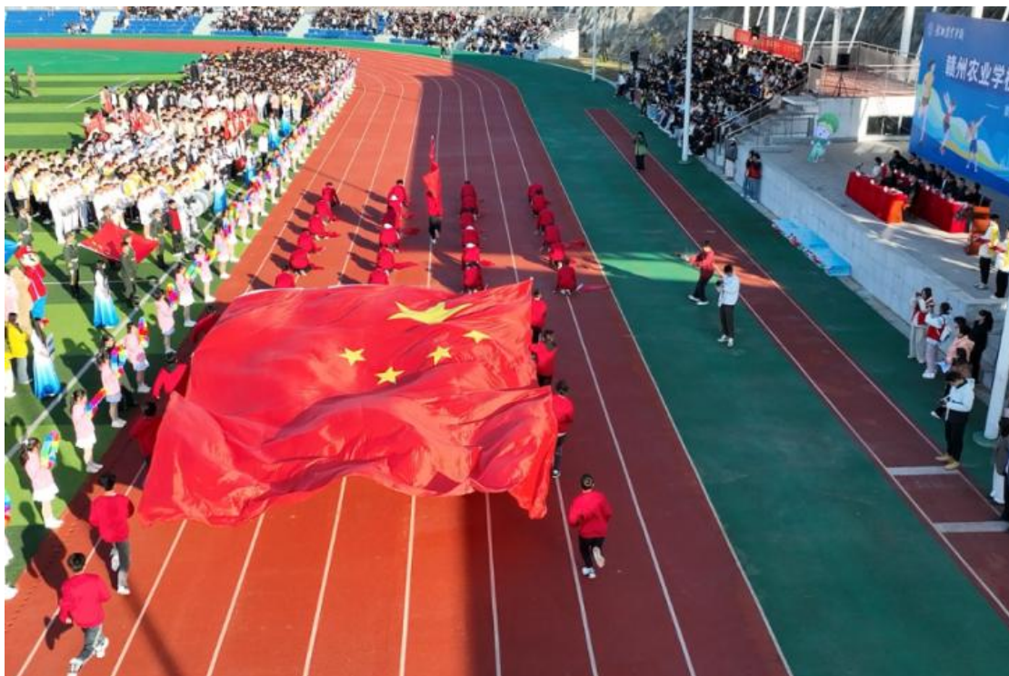
图 4-5 第二十九届田径运动会开幕