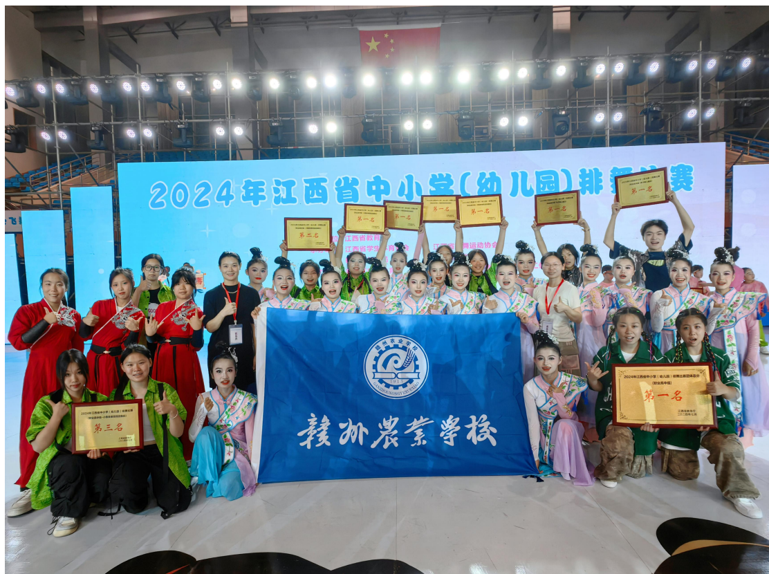
图 2-14 参加江西省中小学（幼儿园）排舞比赛

脱颖而出，为学校赢得了荣誉。赣州农业学校一直注重学生的全面发展，通过举办各类才艺大赛等活动，为学生提供了展示自我、锻炼能力的平台。此次获奖，不仅是参赛学生和指导老师努力的成果，也是学校长期坚持艺术教育的生动体现。