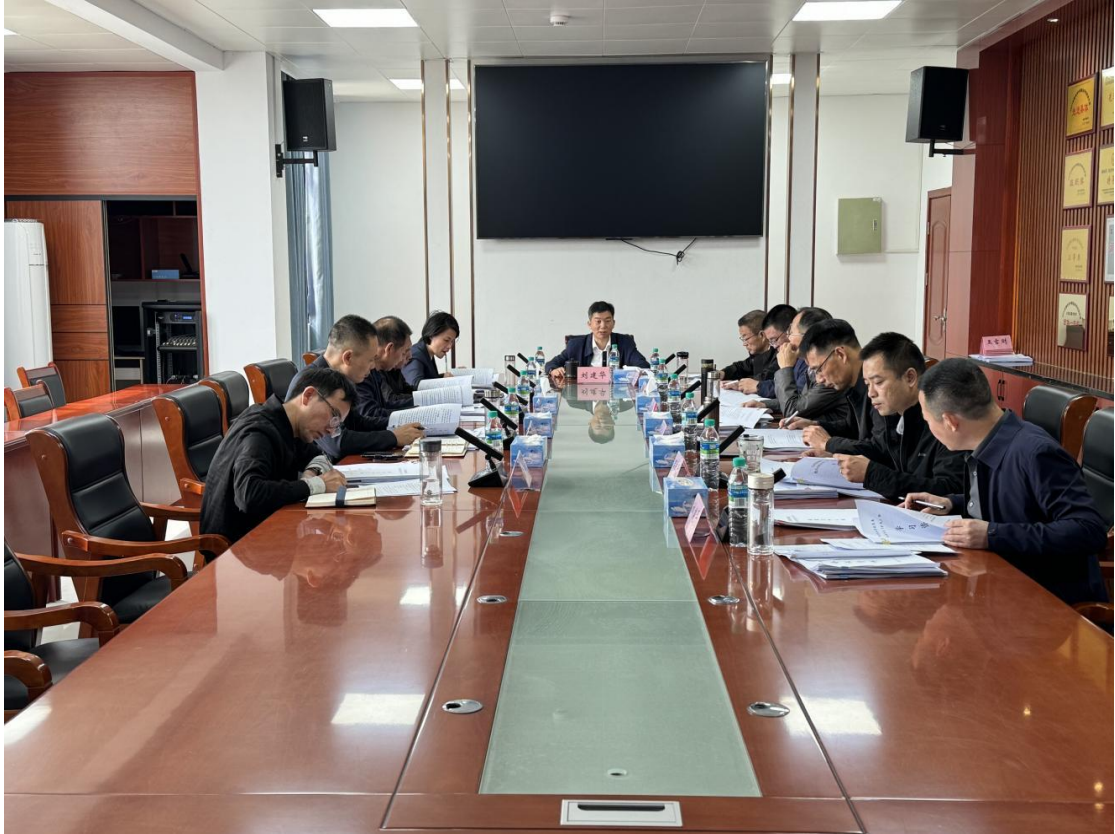
图 2-2 党委理论学习中心组（扩大）专题学习会