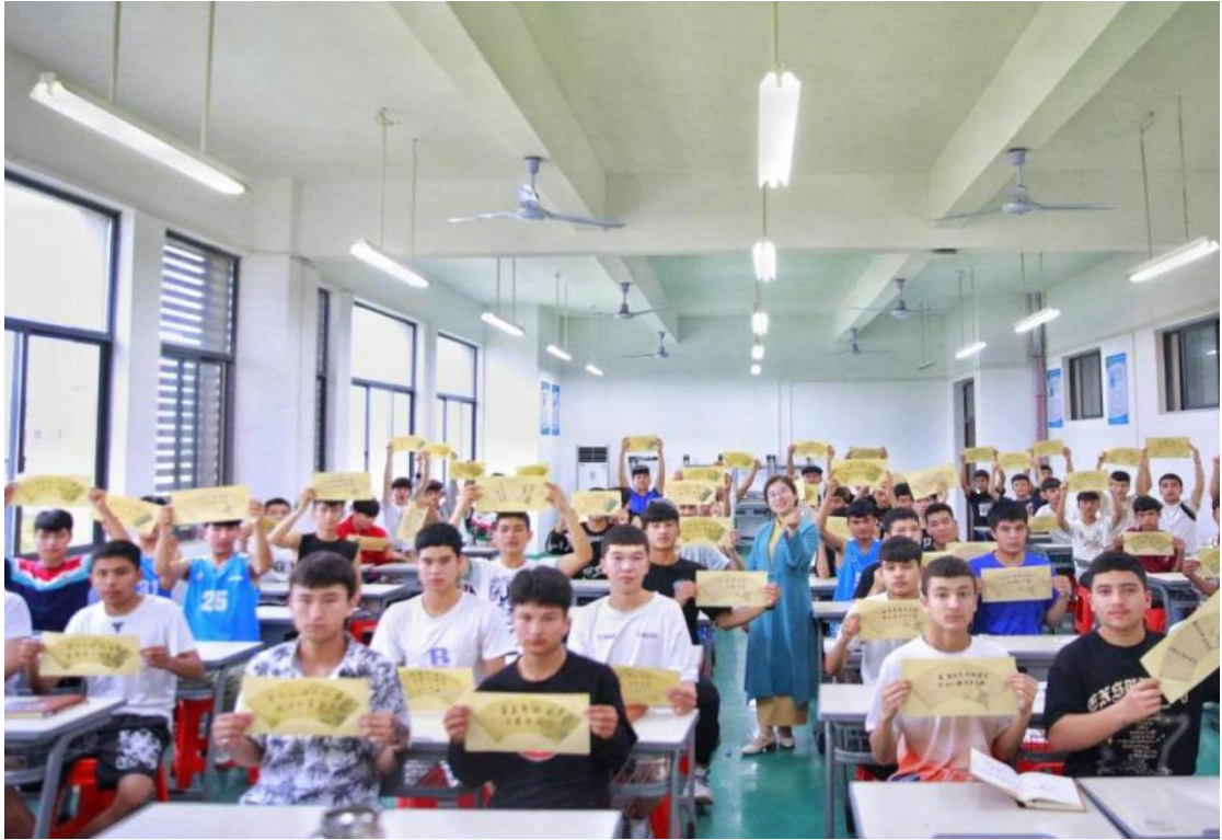
图 3-1 在阿克陶中等职业学校为学生授课