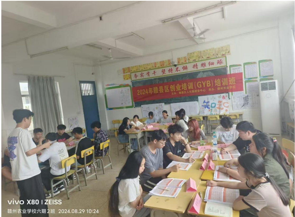
图 2-12 2024 年赣县区创业培训（GYB）培训班