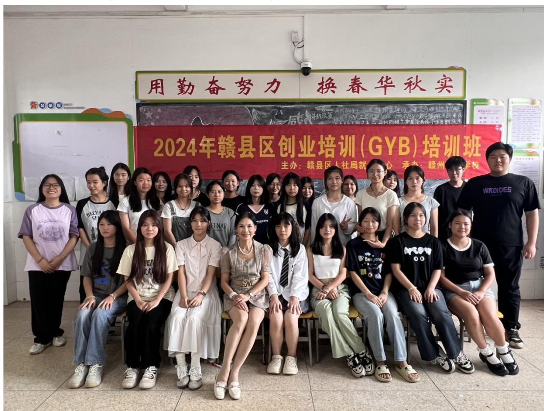
图 3-4 GYB 创业培训学员与教师合影

培训工作有条不紊、安全顺利开展。培训过程中学员积极参与学习互动与发言，课后与老师一起交流创业中遇到的问题。许多学员通过这次培训后认为，培训课程结合市场需求，通过具体生动的案例使参训学员在转变创业观念，增长创业知识、增强创业意识的同时，分析自己是否适合创业，增强和增加每个学员的创业构思，预测市场，防范风险，减少损失，追求创办一流的企业。