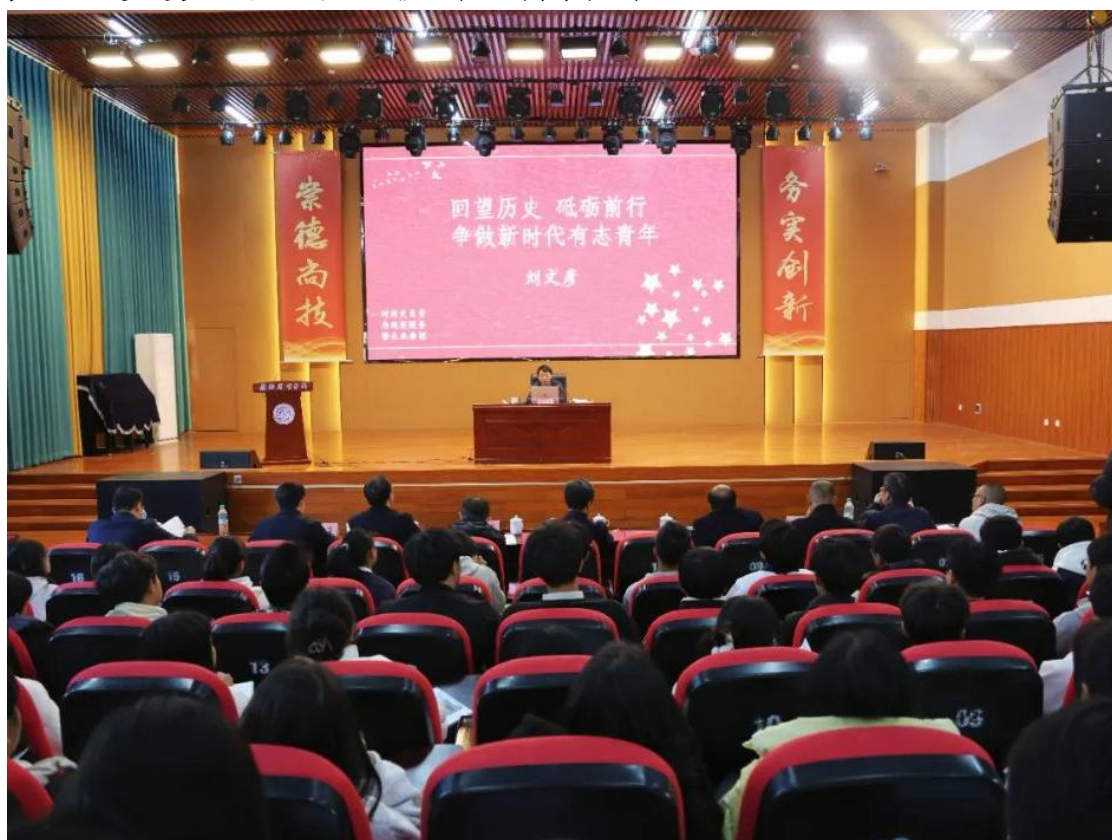
图 4-2 区委书记、区长刘文彦为师生上思政课

堂上，师生们认真聆听，用心记录，大家受益匪浅，纷纷表示在今后的学习工作中以此为指引，秉持乡土情怀，坚定理想信念，赓续农校历史，做到厚植爱国强国抱负、追逐梦想、潜心修身，努力铸就出彩人生。