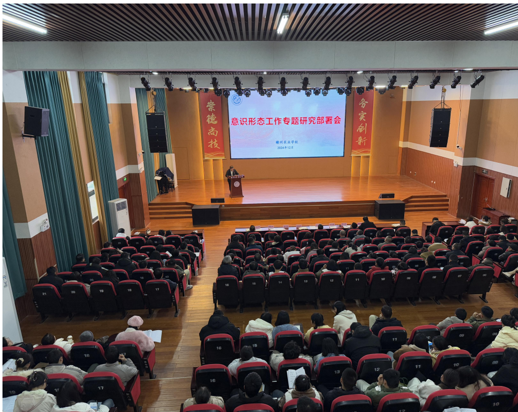
图 2-1 意识形态工作专题研究部署会

学校以深入学习贯彻习近平新时代中国特色社会主义思想 and 党的二十届三中全会精神为主线，以办人民满意的职业教育为根本遵循，扎实开展主题教育，统筹推进党建工作，强化从严治党，大力加强师德师风建设和教师队伍建设，做好意识形态工作，围绕教育教学工作中心，为学校发展提供坚强的思想和作风保证，促进全面发展。