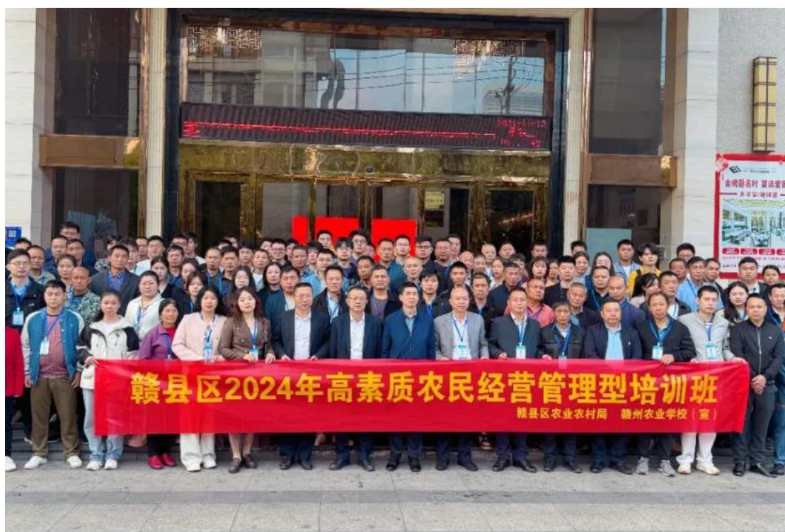
图 6-5 高素质农民经营管理型培训班

11月11日至20日,由赣州农业学校承办的2024年赣县区高素质农民经营管理型培训班圆满落下帷幕,本次培训吸引了全区100余名职业农民踊跃参与。本次培训聚焦增强农民经营管理能力,涵盖现代农业管理理念、粮油作物高效生产技术及乡村建设路径等课程。专家授课深入浅出,结合实际,学员与成功农民企业家面对面交流经验,实地考察先进农业生产模式和项目,加深了对现代农业经营管理实践的理解。通过此次培训提升了农民专业技能,促进培育了一批有情怀、懂技术、善经营、会管理的新时代“新农人”,扩大高素质农民队伍,为乡村振兴提供坚实的人才保障。