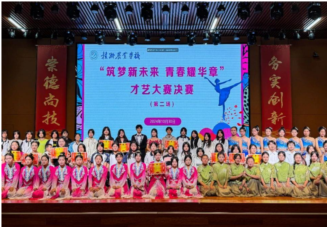
图 4-4 “筑梦新未来青春耀华章” 学生才艺大赛