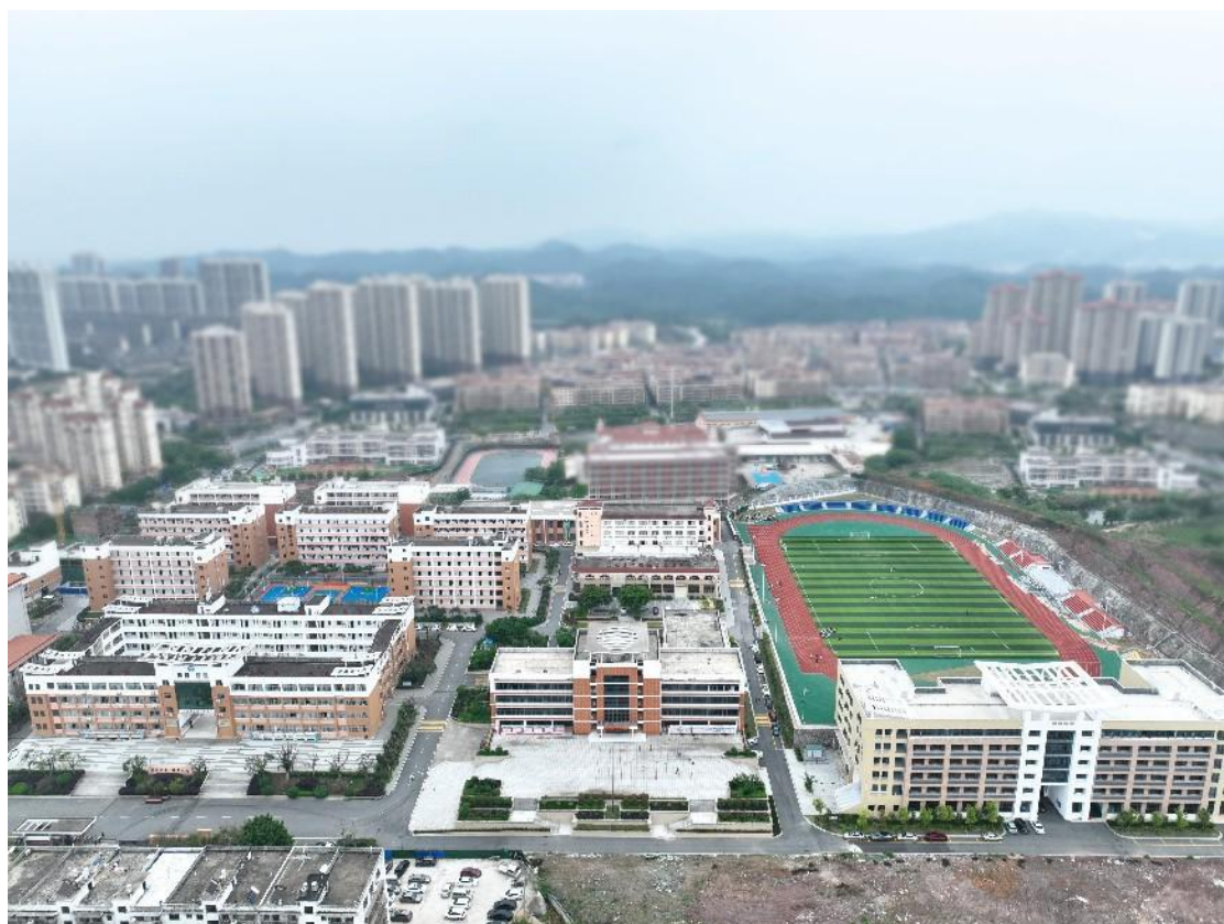
图 1-1 学校鸟瞰图

学校不断深化教育教学改革，办学成效明显。近年来，学校教师科研项目省部级以上立项 20 余项，发表论文 500 余篇，核心期刊论文 20 余篇，主编或参编各类教材 20 余部，先后有 20 余名教师被聘为省市级各类专家，10 余人次获得省市级以上各类荣誉称号。全国新型职业农民培育示范基地、江西省现代农业技术培训基地、江西省退役士兵职业教育和技能培训学校、中国农业大学人文与发展学院·赣南乡村振兴研究院等项目落户学校。央视新闻、学习强国、人民周刊、中国教育报、中国网、大江网、赣南日报等国家及省市级媒体对学校发展竞相报道。