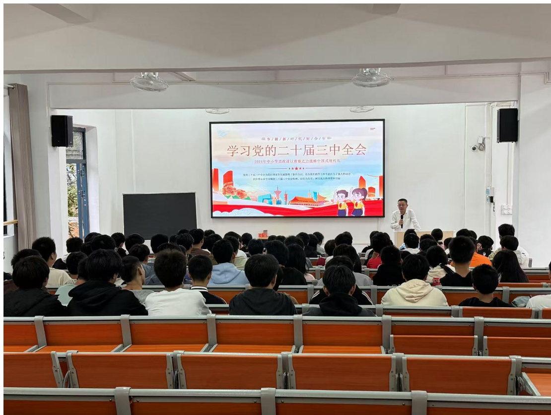
图 2-6 校长上“学习党的二十届三中全会”党课