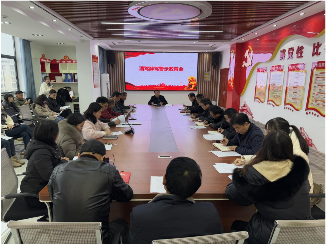
图 2-5 酒驾醉驾警示教育会