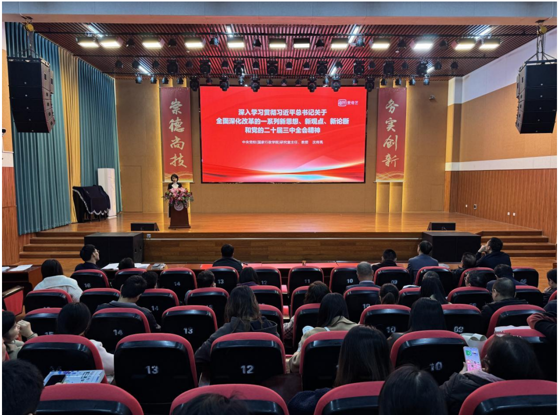
图 2-3 开展学习贯彻党的二十届三中全会精神培训