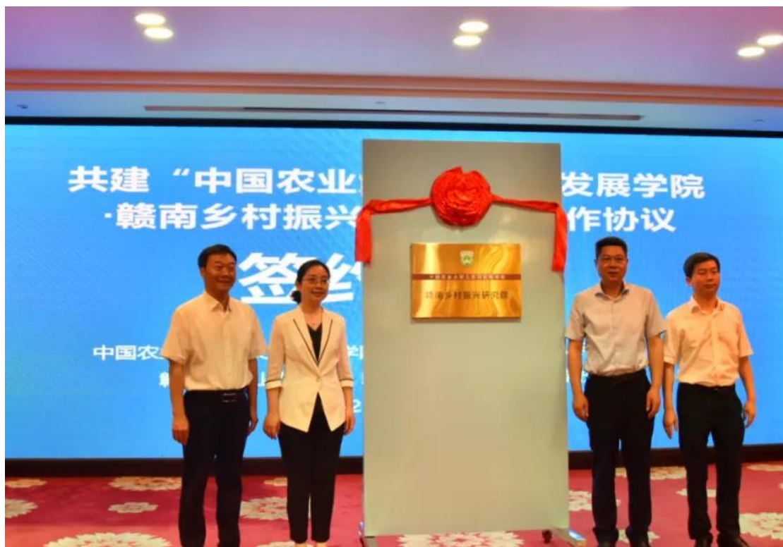
图 6-1 赣南乡村振兴研究院签约仪式

人才培养、科学研究和社会服务等方面累结硕果，推动赣州农业职业教育和涉农科创发展，为农业农村现代化建设注入新的活力，为赣南革命老区的振兴与发展提供坚实保障。