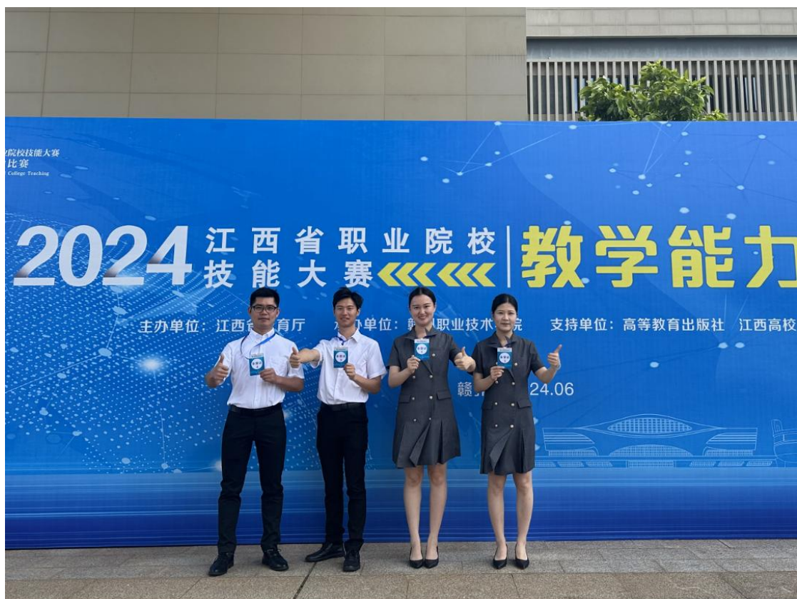
图 2-13 “文物焕新” 插画设计与制作团队

2024 年度（截至 9 月 1 日）学校各级各类技能大赛中，获国家级一等奖 4 项、二等奖 4 项、三等奖 6 项，省级一等奖 13 项、二等奖 26 项、三等奖 19 项。在 2024 年江西省职业院校技能大赛教学能力比赛中，《“文物焕新” 插画设计与制作》荣获一等奖。