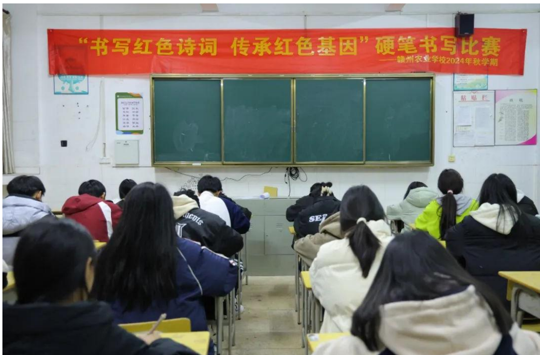
图 4-6 硬笔书写比赛