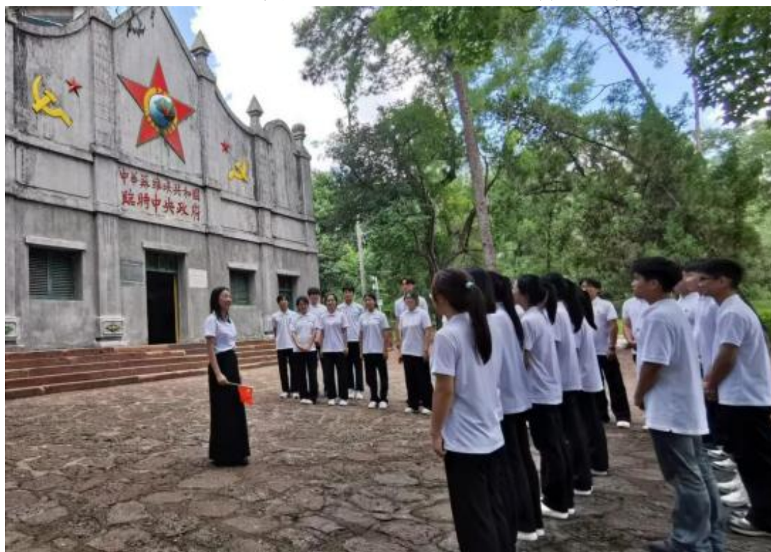
图 4-1 瑞金“二苏大”会址宣讲现场

赣州农业学校将创建党通过一系列创新举措，将党的创新理论进校园、进课堂、进头脑，让宣讲成为学校师生思想进步的“金钥匙”和行动指南。创新宣讲形式，让理论生动起来学校积极组织师生开展丰富多彩的宣讲活动，让创新理论在校园内生根发芽。学校各个社团结合自身特点，将创新理论融入社团活动中，让宣讲更加贴近学生实际。同时，学校还利用校园网、微信公众号等新媒体平台开展线上宣讲，让创新理论随时随地都能触达师生。