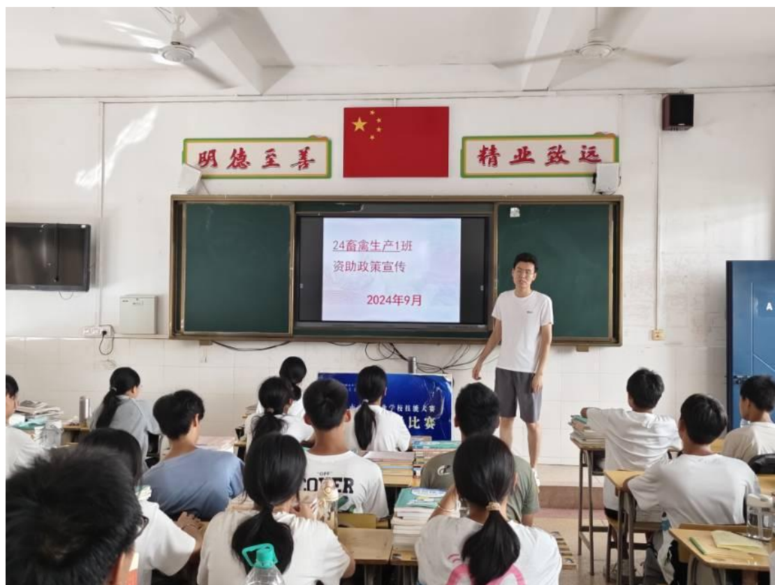
图 7-1 资助政策解读

落实资助政策，提升育人成效。学校精准落实国家资助政策，将立德树人作为资助工作的出发点和落脚点，不断完善精准资助体系、创新资助工作方法，努力提高资助育人科学化规范化精准化水平，各项资助的总人数和资助总金额逐年上升，取得良好的资助育人成效。