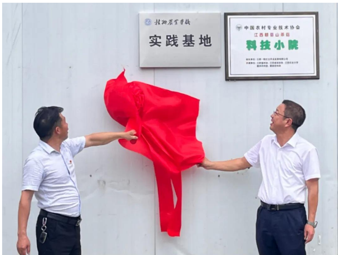
图 6-6 江西一粒红尘农业发展有限公司实践基地揭牌

该基地位于赣县区南塘镇清溪村，目前已发展形成本土菌种研发、菌种制作、鲜菇培植、农产品深加工、有机肥料生产、试验基地种植、研培科普、乡村文旅等多个板块业务，有力促进了当地产业发展、农民增收。