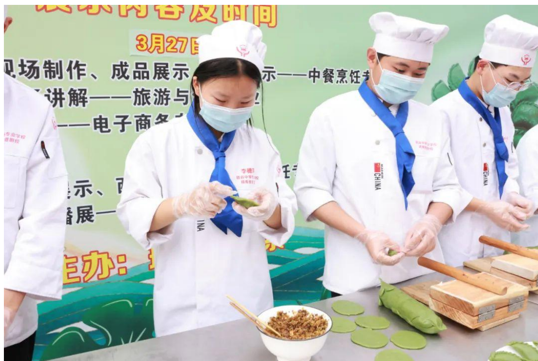
图 2-10 中式面点社 “三展联动携 ‘艾’ 而来”