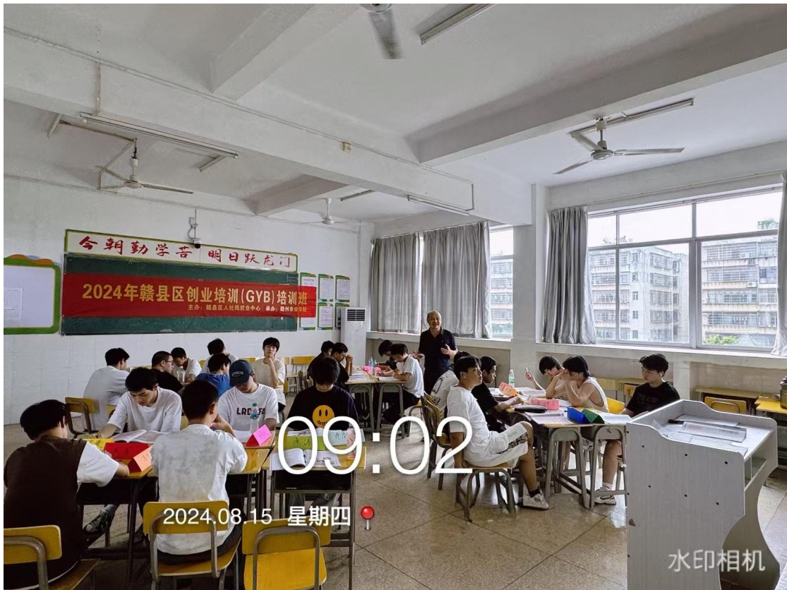
图 3-1 GYB 培训课堂

本次选择了一批符合 GYB 创业培训的农村转型就业劳动者。学校派遣具有 SYB 创业讲师资质证书的专业培训师担任，教学经验十分丰富，在培训教学的过程中注重师生互动，用具体生动的案例及系统的讲解培养学员们对创业思维的认知，激发了学员们的创业热情。参训学员在转变创业观念，增长创业知识、增强创业意识的同时，分析自己是否适合创业，增强了创业构思。课堂中使用教师引导、学员参与这种互动教学模式，提高了趣味性、针对性和适用性，使学员对市场预测、风险防范能力，追求创办一流的企业。