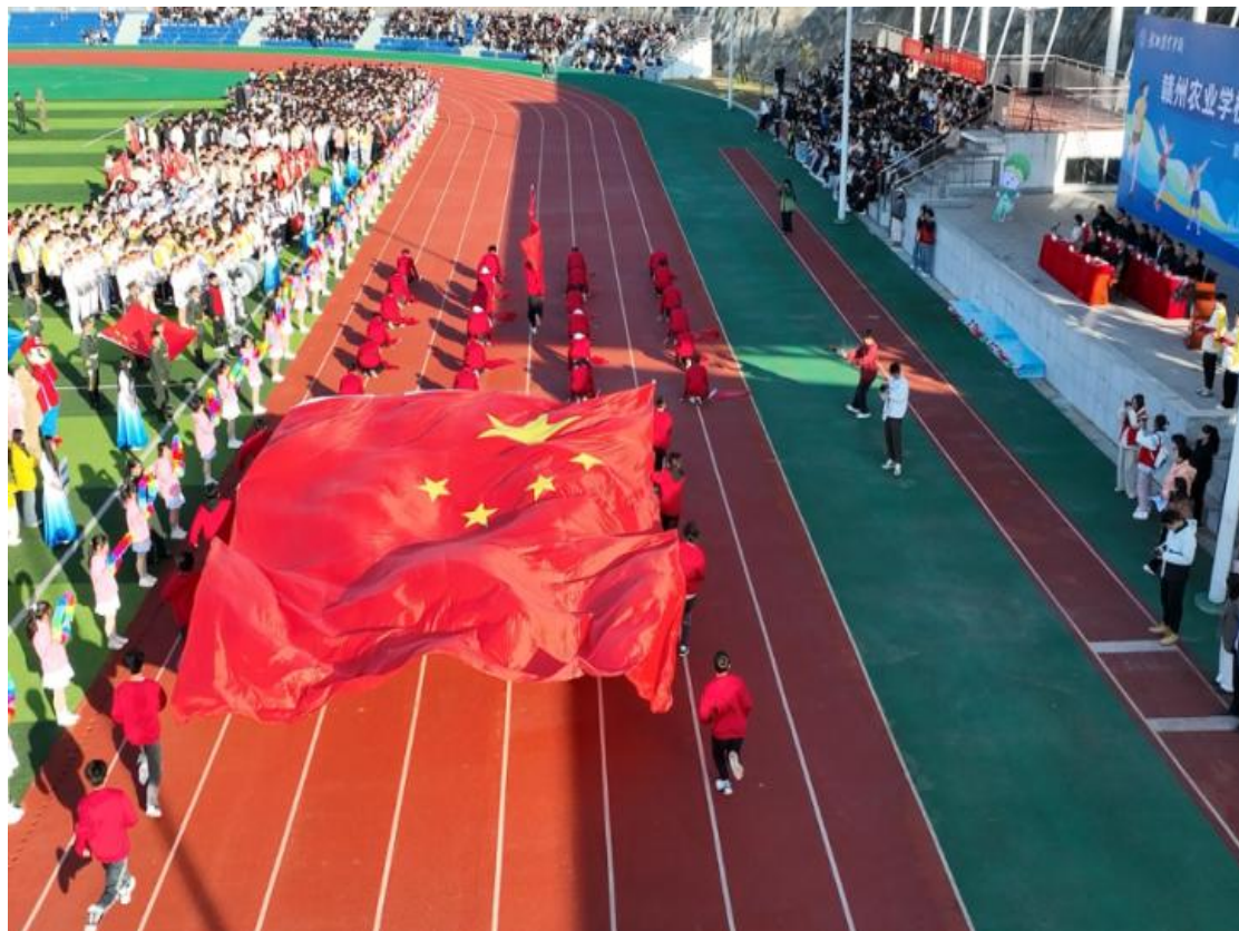
图 4-6 第二十九届田径运动会开幕

尽显农校学子无限风采与蓬勃活力。生命因运动而精彩，青春因激情而闪光。开幕式后，精彩比赛正式开始，让我们共同为运动员们加油助威，共同期待赛场上每一个激动人心的瞬间，共同见证运动员们在赛场上创造辉煌！