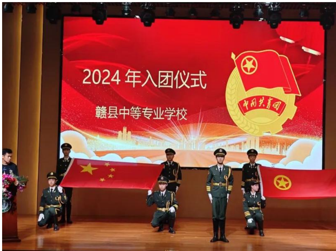
图 4-3 赣县中专新团员入团仪式