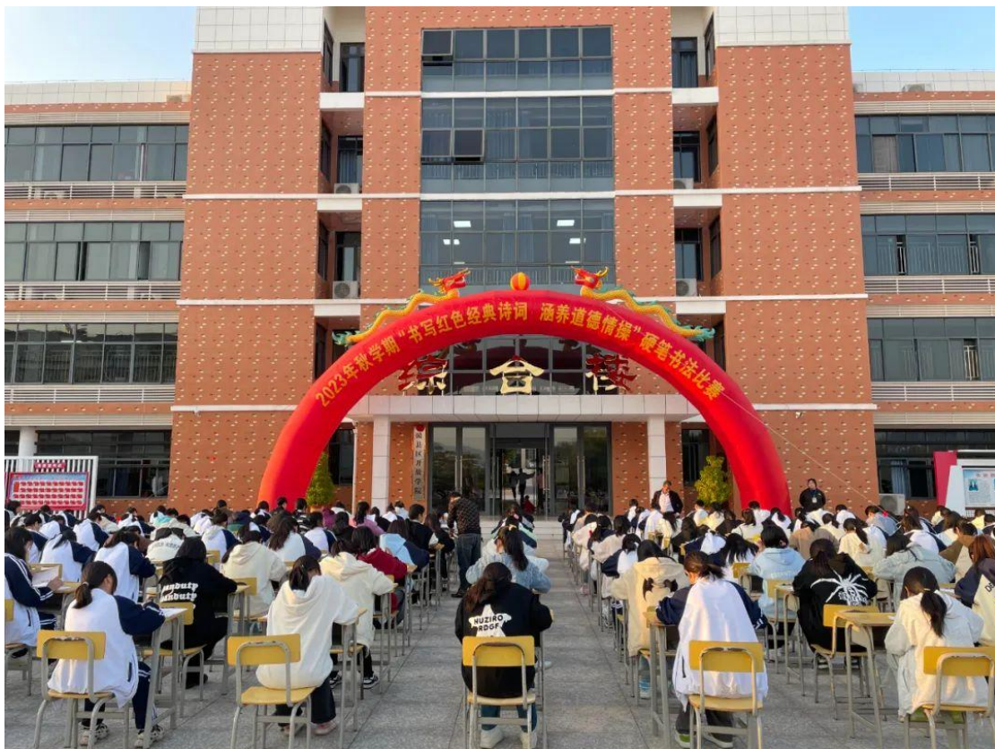
图 4-5 举行硬笔书法比赛