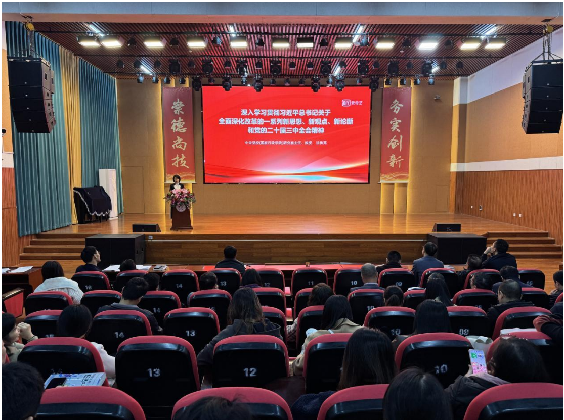
图 2-4 学校开展学习贯彻党的二十届三中全会精神培训