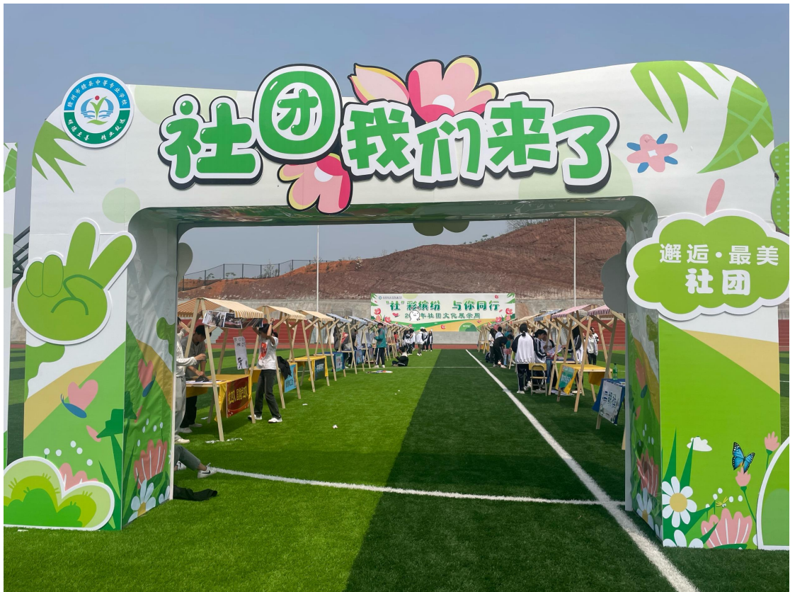
图 2-12 第一届社团文化节