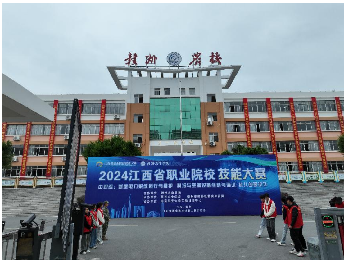
图 2-16 承办 2024 年江西省职业院校技能大赛