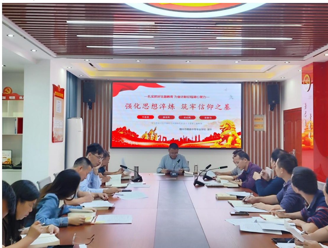
图 2-7 上党课“强化思想淬炼筑牢信仰之基”

用电用气安全教育、食品卫生安全教育、传染病预防教育、预防校园欺凌教育、反电信诈骗预防教育及学生行为习惯养成教育和遵规守纪等教育为抓手，培养学生积极的人生态度、健康的心理情感、高尚的道德品质，懂得尊重生命，珍视生活，学会生存。在各类活动中以弘扬中华优秀传统文化为导向，积极开展党史教育，传承红色基因和革命薪火，培养同学们爱党、爱国、爱人民的优良品质，进一步坚定共产主义理想信念，成为德技双修的合格技能型人才。