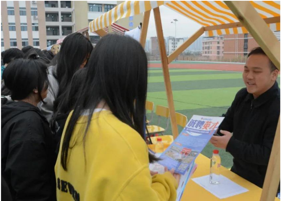
图 2-14 学生参与 2024 年校园招聘会