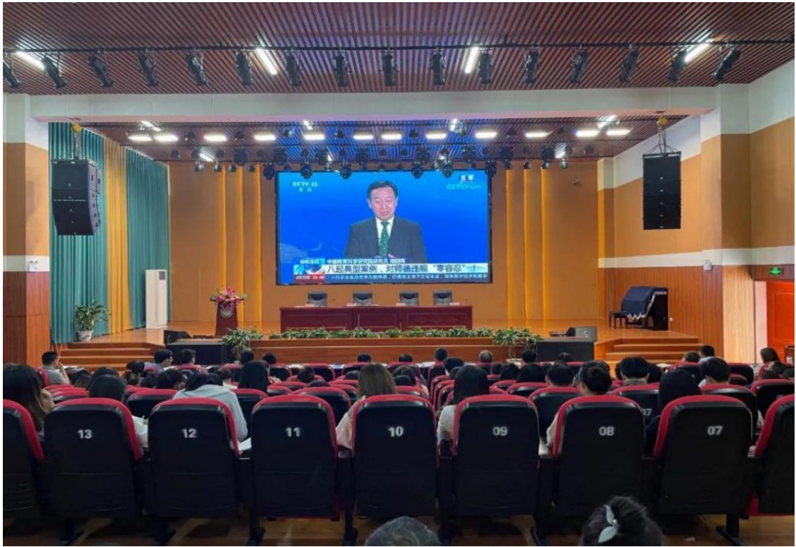
图 7-2 开展师德师风警示教育会