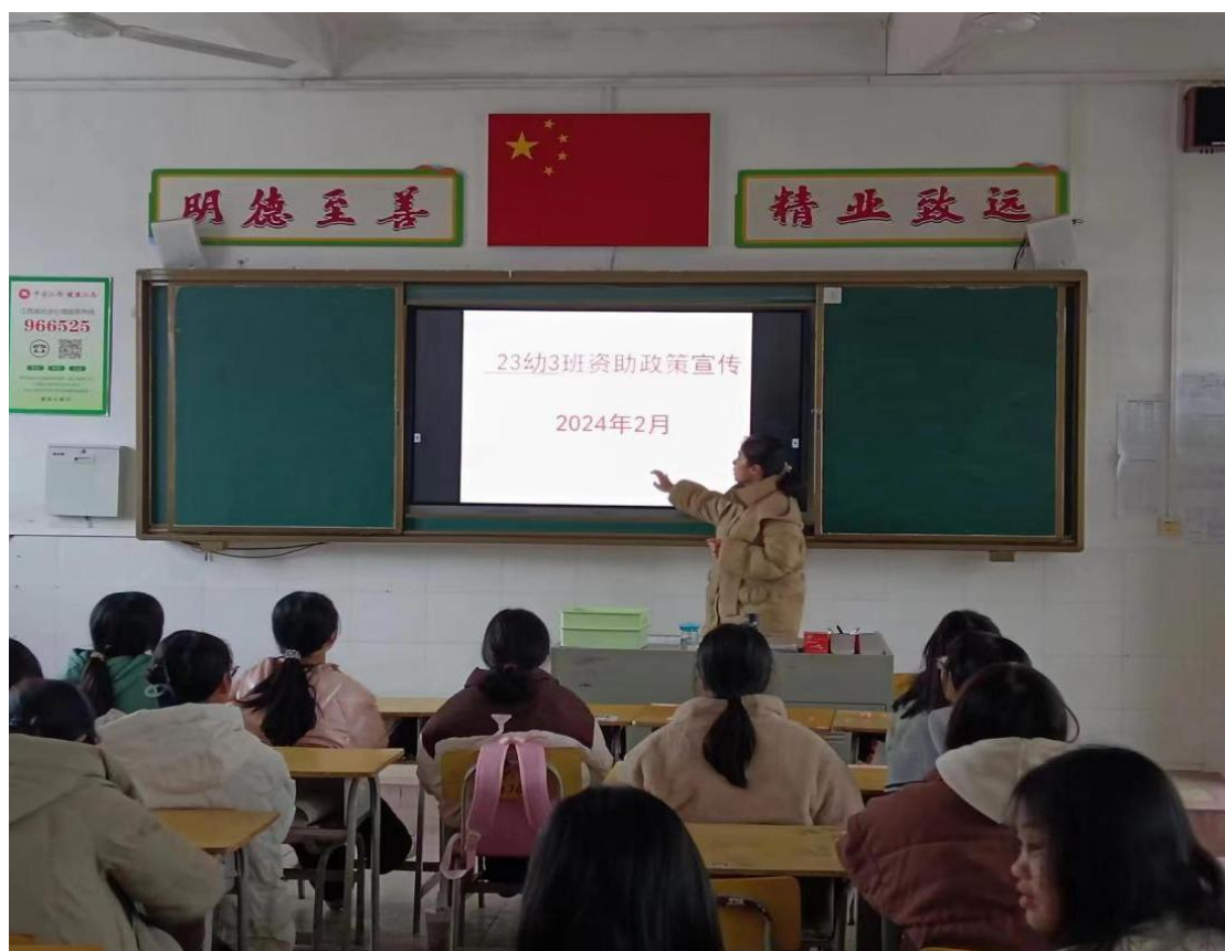
图 7-1 资助政策解读

落实资助政策，提升育人成效。学校精准落实国家资助政策，将立德树人作为资助工作的出发点和落脚点，不断完善精准资助体系、创新资助工作方法，努力提高资助育人科学化规范化精准化水平，各项资助的总人数和资助总金额逐年上升，取得良好的资助育人成效。2023-2024 年学年，全年为三校共 13142 人次学生提供了免学费、奖学金和助学金，总计 1429.565 万元。