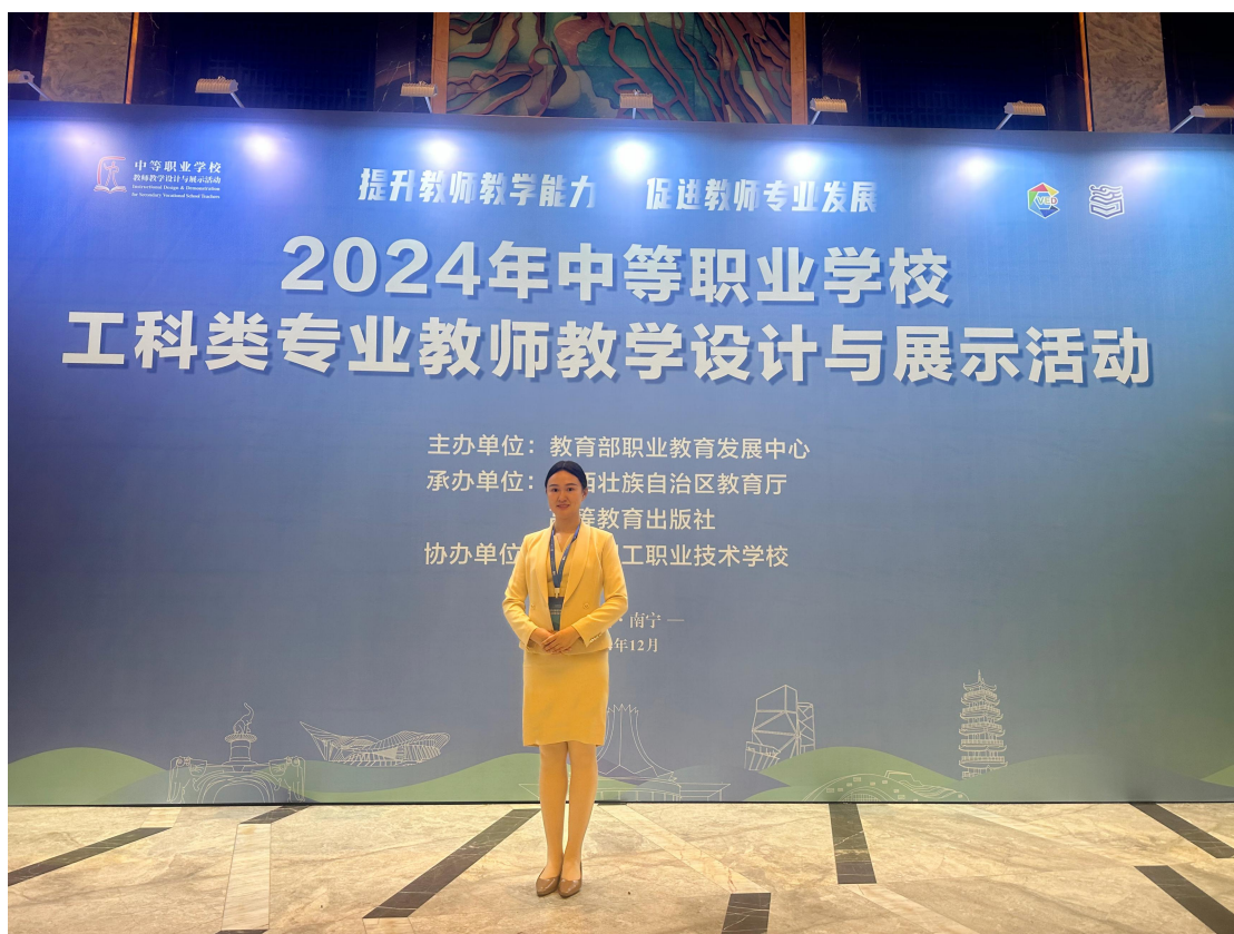
图 7-5 教师参加国家级教学案例展示

2024年我校有6名教师参加国家级优秀教学案例展示并获得优质教学案例荣誉。2023年下半年我校七支团队在2023年江西省职业院校技能大赛教学能力比赛和班主任能力比赛中全部获奖；其中获得一等奖5个，二等奖2个，成绩列全市第一。其中四支队伍进入教学能力国赛，获二等奖2项，三等奖一项。