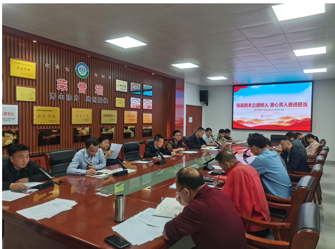
图 2-1 师德专题党课

结合学生家庭背景、学习情况、心理状态等因素，制定个性化“万师访万家”党员家访计划，确保家访工作的针对性和实效性。党员教师在家访中深入了解学生家庭情况，与家长进行深入交流，分享教育理念，共同探讨孩子的成长问题，增进家校之间的理解和信任。对经济困难家庭、留守儿童家庭、残疾学生家庭等给予特别关注，提供力所能及的帮助和支持，传递党的温暖与关怀。