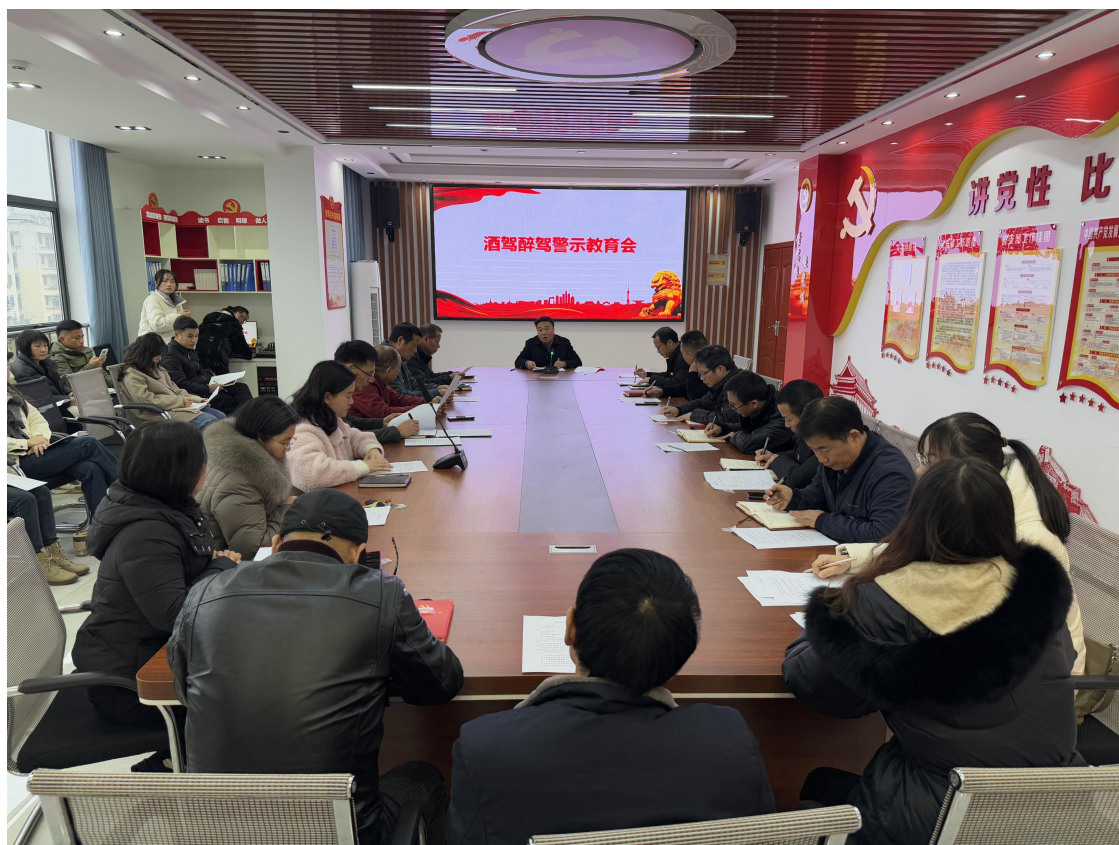
图 2-6 赣县中等专业学校党支部酒驾醉驾警示教育会