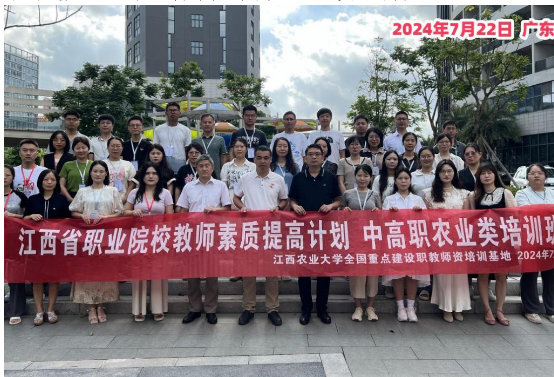
图 7-4 教师参加国家级教学实践能力培训

为贯彻落实《中共中央国务院关于全面深化新时代教师队伍建设改革的意见》精神，进一步加强我省职业院校“双师型”教师队伍建设，根据江西省教育厅教师工作处《关于做好江西省2023年度职业院校教师素质提高计划项目实施工作的通知》要求，将举办中高职农业类培训班。