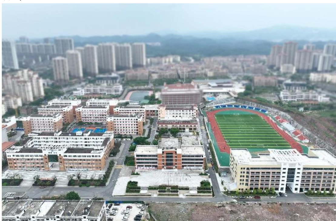
图 1-1 学校鸟瞰图