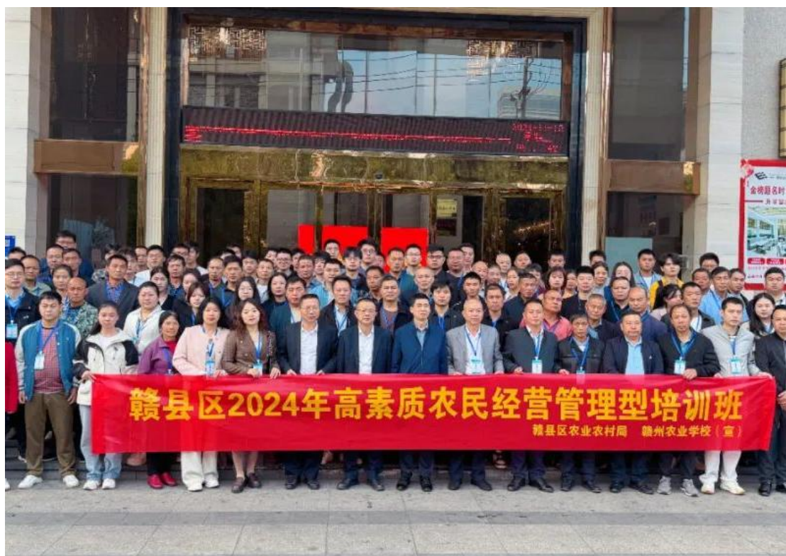
图 6-5 高素质农民经营管理型培训班

11月11日至20日,由赣州农业学校承办的2024年赣县区高素质农民经营管理型培训班圆满落下帷幕,本次培训吸引了全区100余名职业农民踊跃参与。本次培训聚焦增强农民经营管理能力,涵盖现代农业管理理念、粮油作物高效生产技术及乡村建设路径等课程。专家授课深入浅出,结合实际,学员与成功农民企业家面对面交流经验,实地考察先进农业生产模式和项目,加深了对现代农业经营管理实践的理解。通过此次培训提升了农民专业技能,促进培育了一批有情怀、懂技术、善经营、会管理的新时代“新农人”,扩大高素质农民队伍,为乡村振兴提供坚实的人才保障。