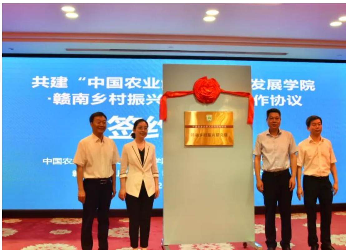
图 6-1 赣南乡村振兴研究院落户赣州农业学校签约仪式

农业是立国之本，强国之基。在国家实施乡村振兴战略的背景下，我校将积极响应号召，依托中国农业大学顶级高校的专业、人才、平台等优势，组织师生开展教学培训和社会实践活动，在培训与实践中不断汲取养分，努力培养一批高素质农业人才，促进赣南乡村振兴研究院在人才培养、科学研究和社会服务等方面累结硕果，推动赣州农业职业教育和涉农科创发展，为农业农村现代化建设注入新的活力，为赣南革命老区的振兴与发展提供坚实保障。