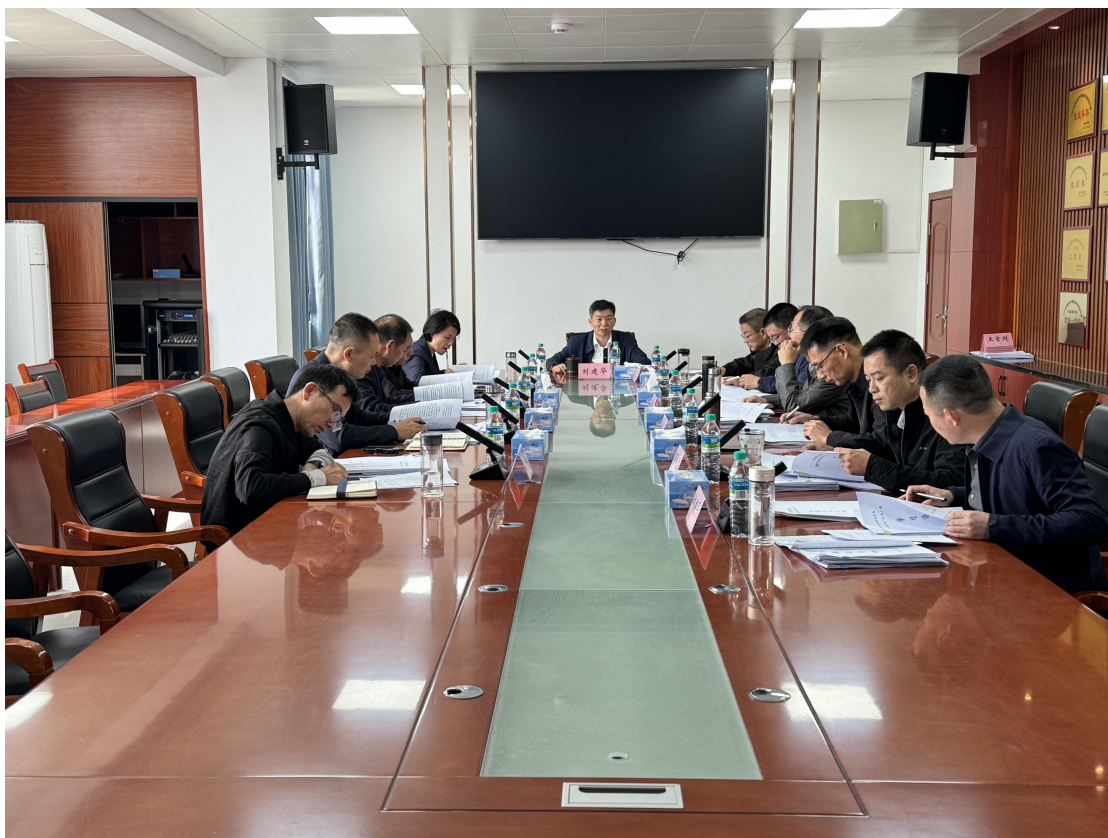
图 2-3 党委理论学习中心组（扩大）专题学习会