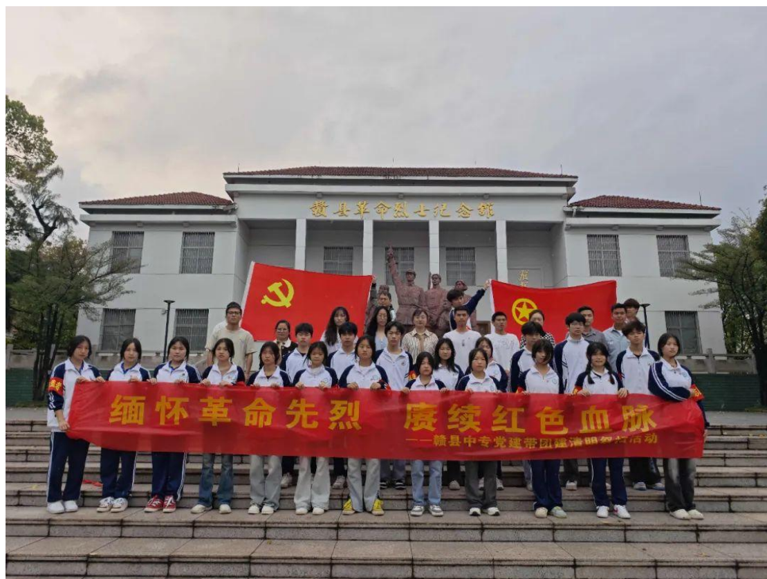
图 4-2 赣县中专开展党建带团建清明祭扫活动

月1日下午，我校赴赣县革命烈士纪念馆开展“缅怀革命先烈，赓续红色血脉”党建带团建清明祭扫活动，追溯历史，感悟英烈精神的时代价值。