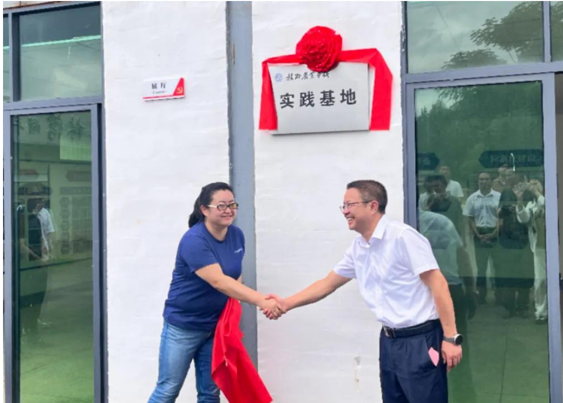
图 6-7 三溪乡湖羊实践基地揭牌

该基地位于作赣县区三溪乡下浓村，现有羊舍 15 栋，存栏湖羊 7000 余头，年出栏羊羔可达 1.2 万头，是江西省最大的湖羊养殖基地，2021 年 8 月全国首个湖羊产业“科技小院”落户该基地。