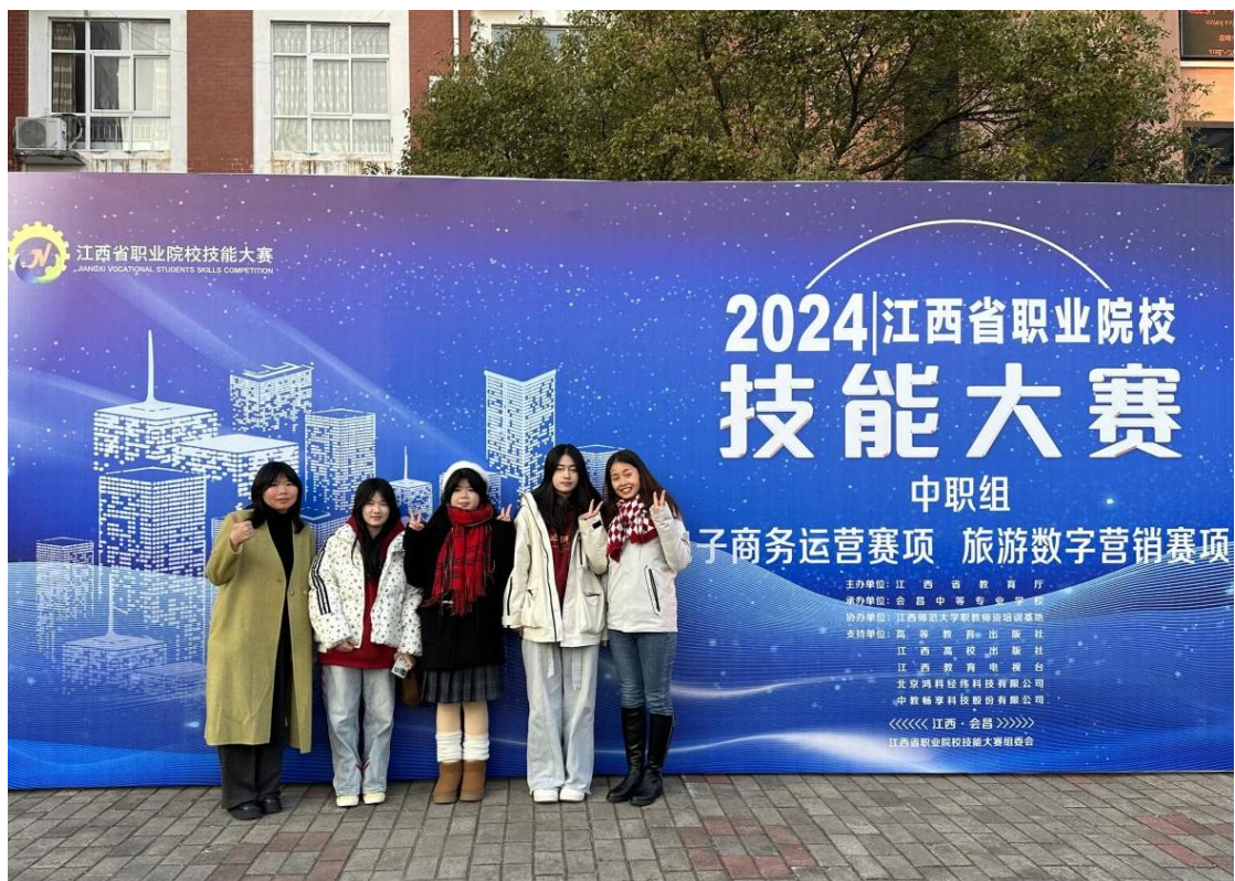
图 2-17 旅游数字营销赛项荣获一等奖