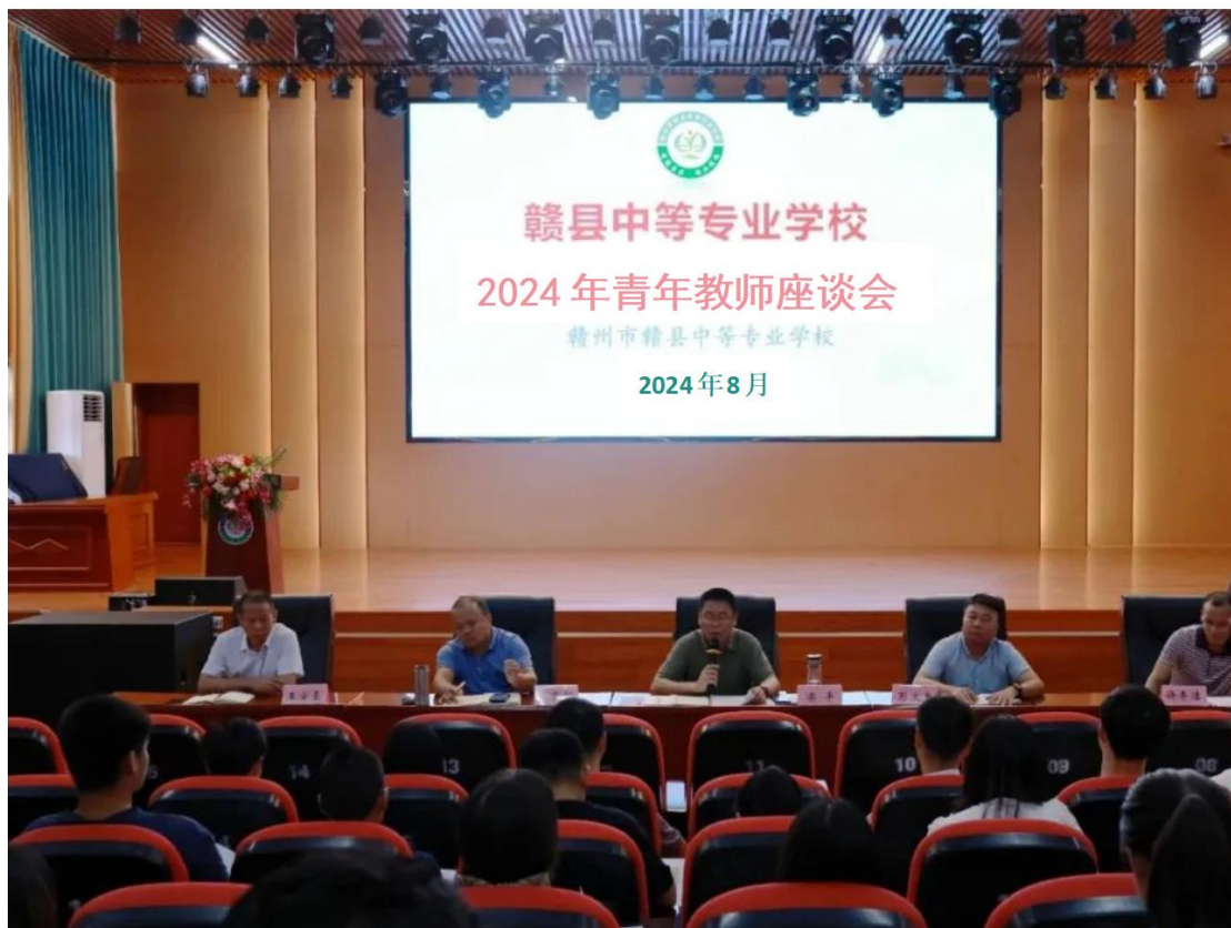
图 7-3 老带青教师座谈会