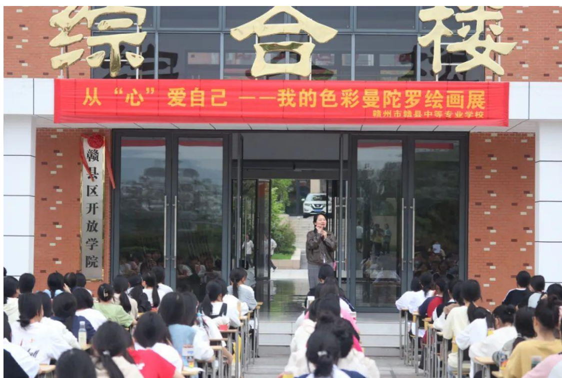
图 2-9 心笑社开展曼陀罗绘画展活动

2024年，各社团以“每月一展”的形式开展了形式丰富的主题活动，如中式面点社在清明节来临之际，于3月27日-28日下午举办了“三展联动携‘艾’而来”主题技能展示活动；手工社开展了“送你一盒春天”手工美术展；通过活动，有效促进了社团发展，充实了学生课余文化生活。