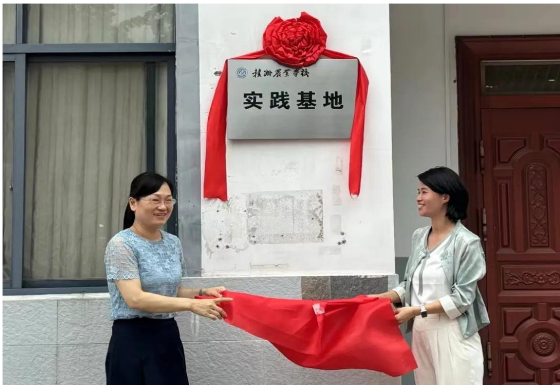
图 6-8 “蜜月岛” 实践基地揭牌