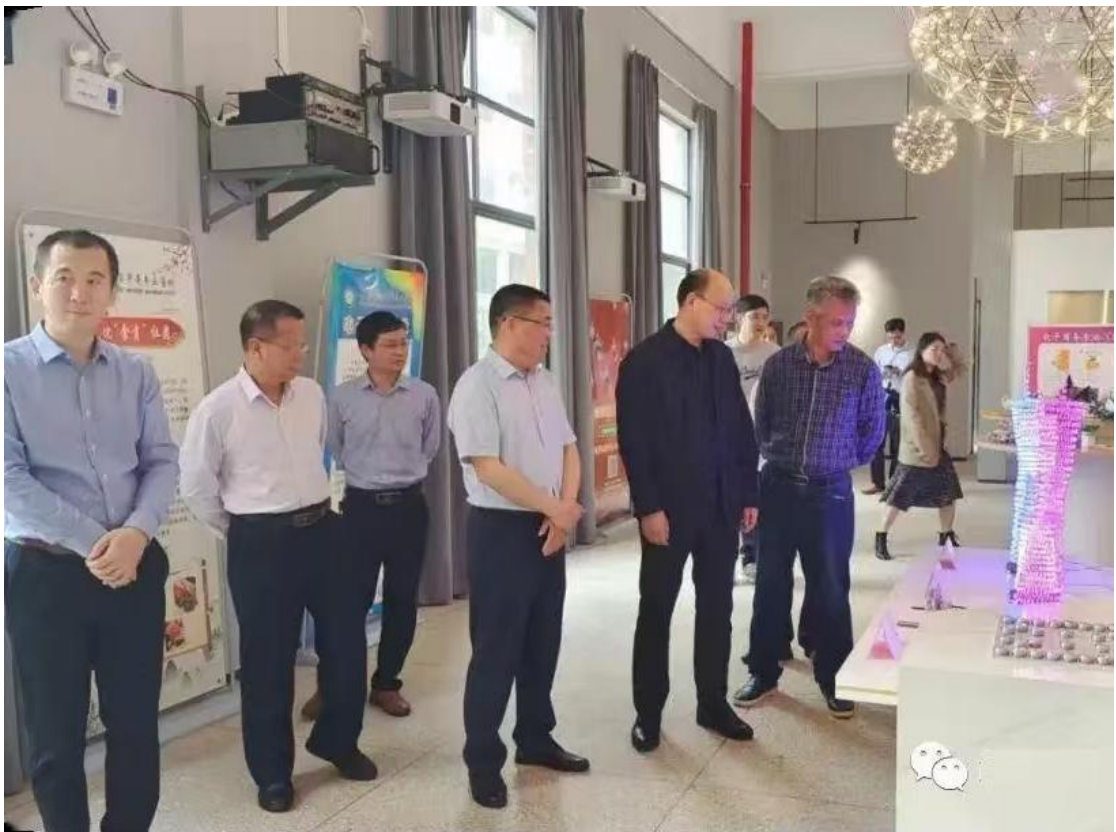
图 6-4 深圳技工教育集团来校交流指导