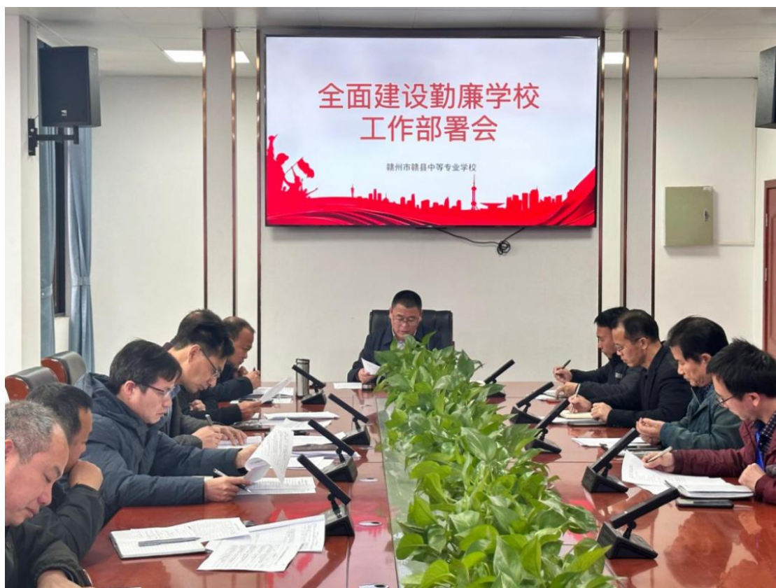
图 4-1 建设勤廉学校系列活动掠影

为深入学习习近平总书记关于勤廉文化建设的重要论述，贯彻落实党中央关于全面从严治党战略方针，深入推进勤廉学校建设，增强全体教职工勤廉从教意识，培养学生崇廉价值观念，我校结合自身的特点和日常工作，开展形式多样的教育活动，努力在教师、学生中实现勤廉文化进脑、入耳、见行动。