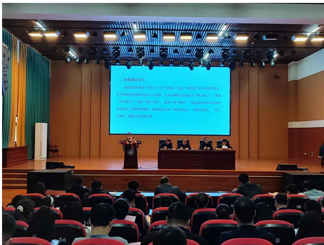
图 2-5 赣县中等专业学校党支部党员大会