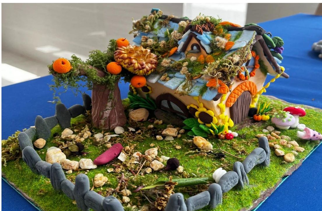
图 2-11 手工社开展了 “送你一盒春天” 手工美术展