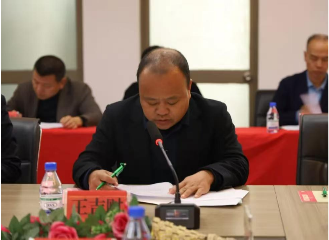
图 6-3 赣州职业教育联盟发言