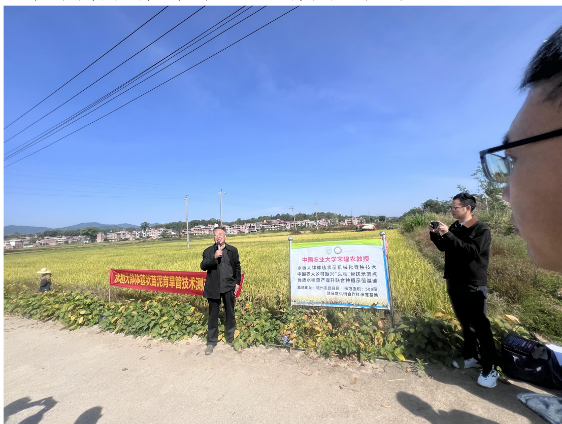
图 6-2 宋建农教授进行水稻测产活动

宋建农为现场人员介绍了水稻大钵体毯状苗机械化育秧技术种植示范基地的基本情况，为现场观摩人员答疑解惑，并提供有针对性的帮扶指导。现场测产结果显示水稻大钵体毯状苗机械化育秧技术增产效果显著。据悉，自5月27日中国农业大学和赣州市农业农村局、赣县区、赣州农业学校开展合作成立赣南乡村振兴研究院以来，开展了一系列服务乡村振兴和农业农村相关的活动。