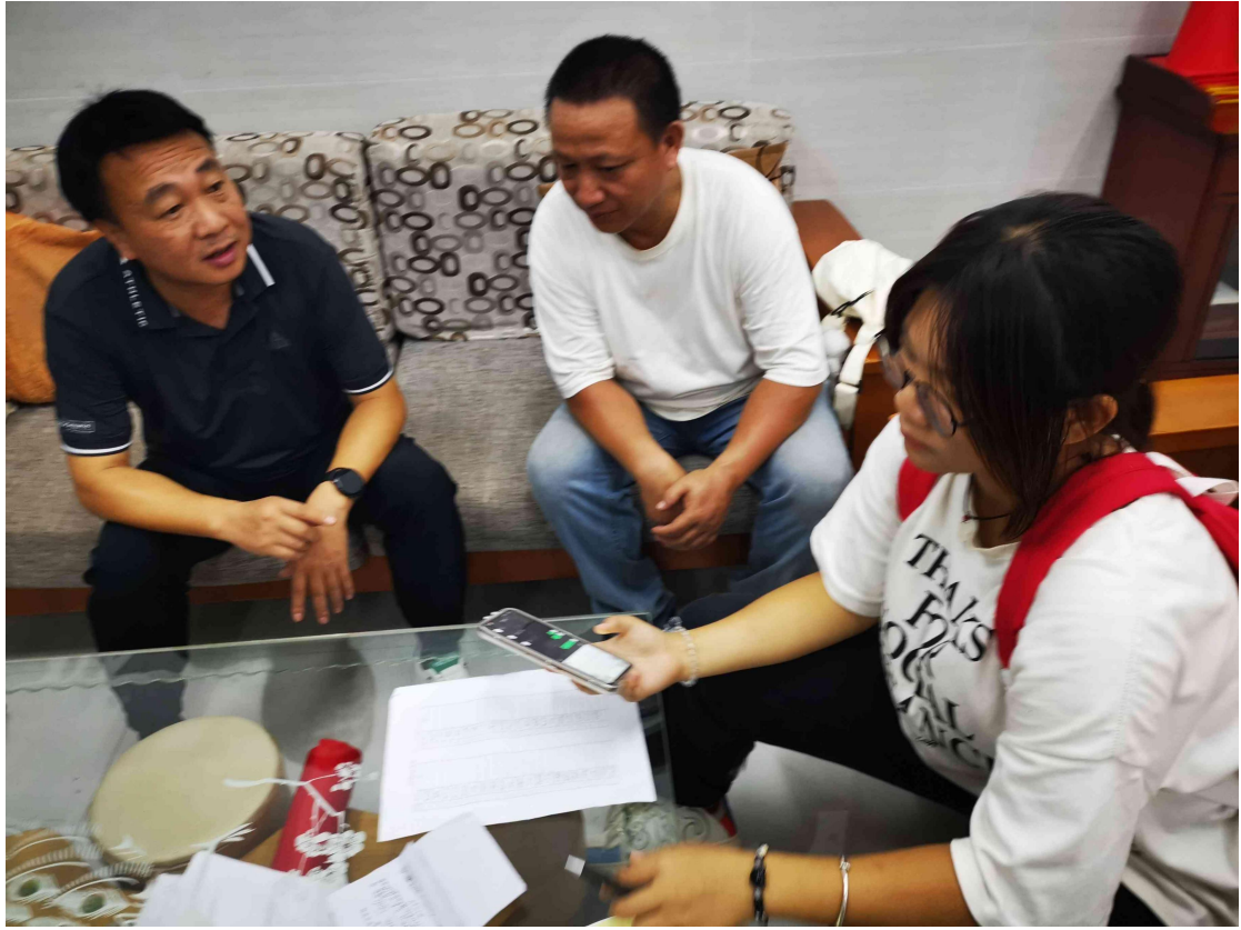
图 2-2 党员“万师访万家”