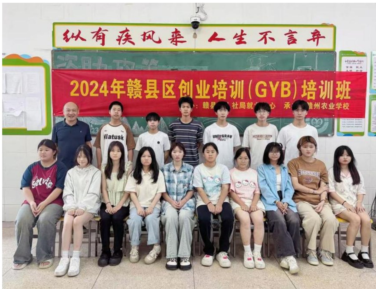
图 2-15 赣县区创业培训（GYB）培训班

绩，部分学生的创业项目已成功落地。未来，学校将继续深化创新创业教育改革，为培养更多具有创新精神和创业能力的中职技能型人才而努力。